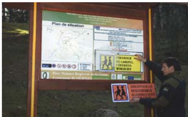
figura 3 – Panel de senalización (macizo de Bavella)

Encontramos el mismo código color en la señalización implantada en los macizos forestales, actualizado también todos los días. Estos paneles dan una información sobre el riesgo del macizo mismo y limitar así la frecuentación.