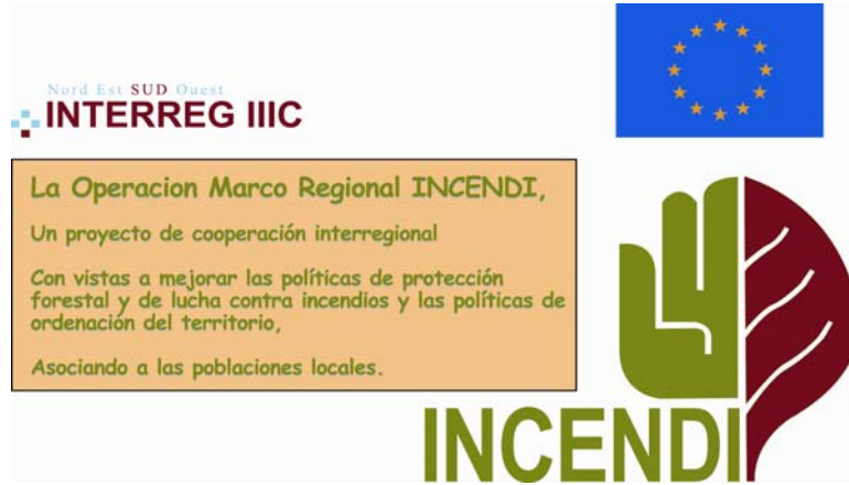
figura 5 – OCR INCENDI

La señalización sobre el riesgo incendio en los espacios naturales de Córcega es un proyecto local del Parque Natural Regional de Córcega dentro del programa europeo INTERREG 3C SUD - OCR INCENDI. Sus objetivos son la aplicación de la señalización en los espacios naturales mas sensibles , o sea los que reciben cerca de 2000 personas diariamente durante el verano.