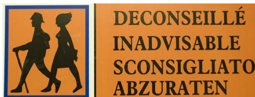
figura 4 – folleto para el nivel de riesgo grave

Un contestador, accesible desde las 17h30, informa a los gestores de los paneles sobre el riesgo del día siguiente por zona para que lo actualizen.